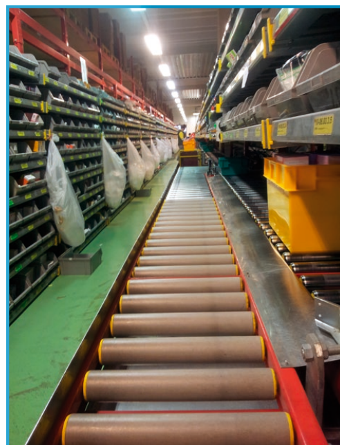
Sklad Provoz Ostrava – vychystávání přípravků