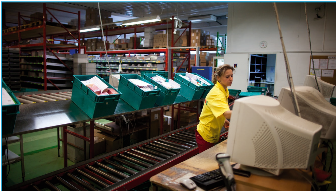
Sklad Provoz Ostrava – příprava k expedici